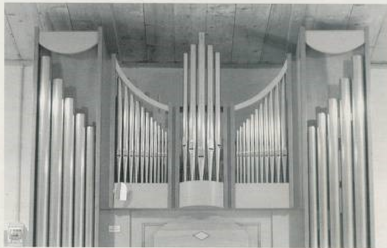
Im Bild die neue Orgel des „Kathrein-Kirchleins“

Die kleine, historisch bedeutende und an einer herrlichen Lage postierte Kirche St. Katharina in der Scharte, die zur Pfarrei Hafling gehört, hat eine kleine sechsregistrierte Orgel aus der Orgelbauwerkstatt Oswald Kaufmann aus Deutschhofen erhalten. Im Vorfeld wurde überlegt, wo man das Instrument am günstigsten aufstellen könnte. Obwohl die Empore wenig Höhe bietet, entschied man sich für diesen in unserer Gegend allgemein verwendeten Aufstellungsort, da der Altarraum zwar mehr Höhe bietet, aber ein Musizieren die liturgische Handlung beeinträchtigen würde und für die Aufstellung eines kleinen Chores oder einiger Instrumentalisten absolut kein Platz zur Verfügung stehen würde. Auch aus denkmalpflegerischen Überlegungen hätte eine Orgel den Gesamteindruck